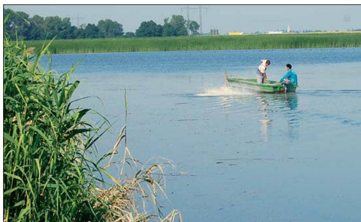
Étetik a tenyészhalat