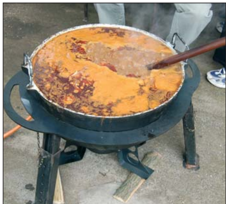
A karcagiak győztes birkapörköltje

nyék számára, ha az önkormányzatok, a vállalkozók összefognak ezen a téren. Szerencsére a folyamat már elindult, de kell még türelem ahhoz, hogy mindenki belássa és egyetértsen a közös célok elérésében.