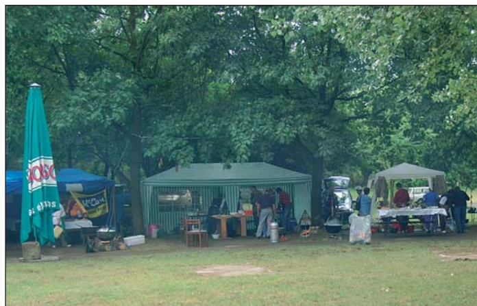
Délelőtt még borús volt az idő

A Tisza folyó – amelynek fejlesztési lehetőségeiről a közelmúltban nyílt parlamenti vitán zajlott – meghatározza a térség jelenét és jövőjét is. A képviselő lát esélyt arra, hogy a Tisza menti önkormányzatok közösen képviseljék el a jövőt. Ez azt jelenti, hogy már létrejöttek olyan együttműködések, amelyek az egész Tiszát érintik. A közös fejlesztések, a kikötők építése, a turisták egyik helyről a másikra való eljuttatása, ellátása akkor lesz sokkal hatékonyabb, és hasznosul jobban a kör-