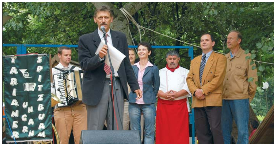
Az eredményhirdetésre már előbukkant a nap

Az ország célkitűzését módosítani kellene, vélte a képviselő. Akkor tud a lokális na-