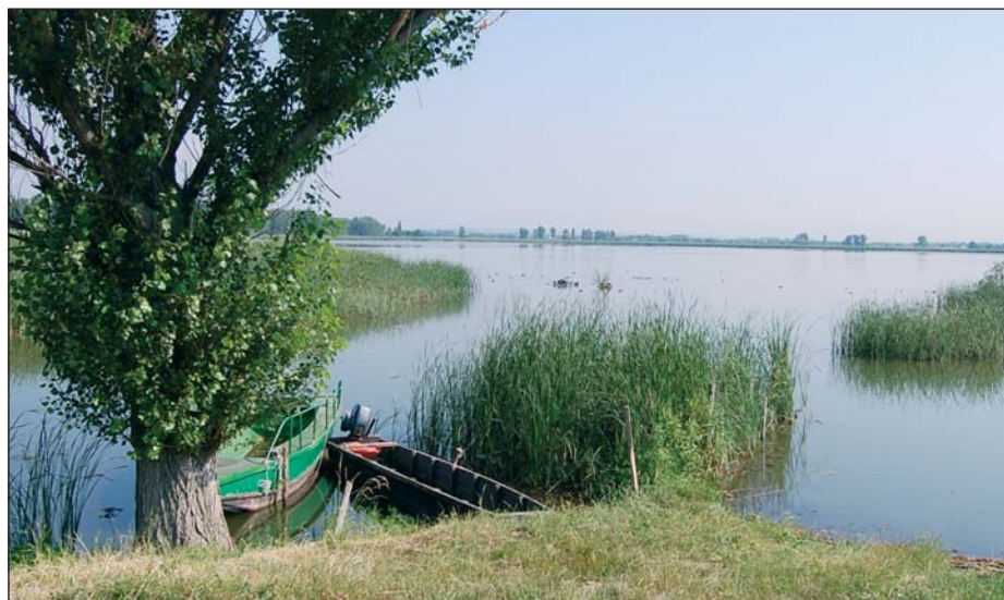
A geleji halastó