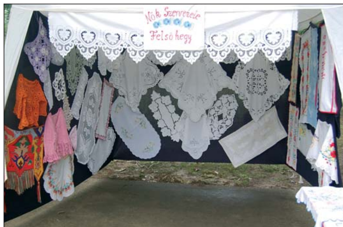
A felsőhegyiek kézimunkája