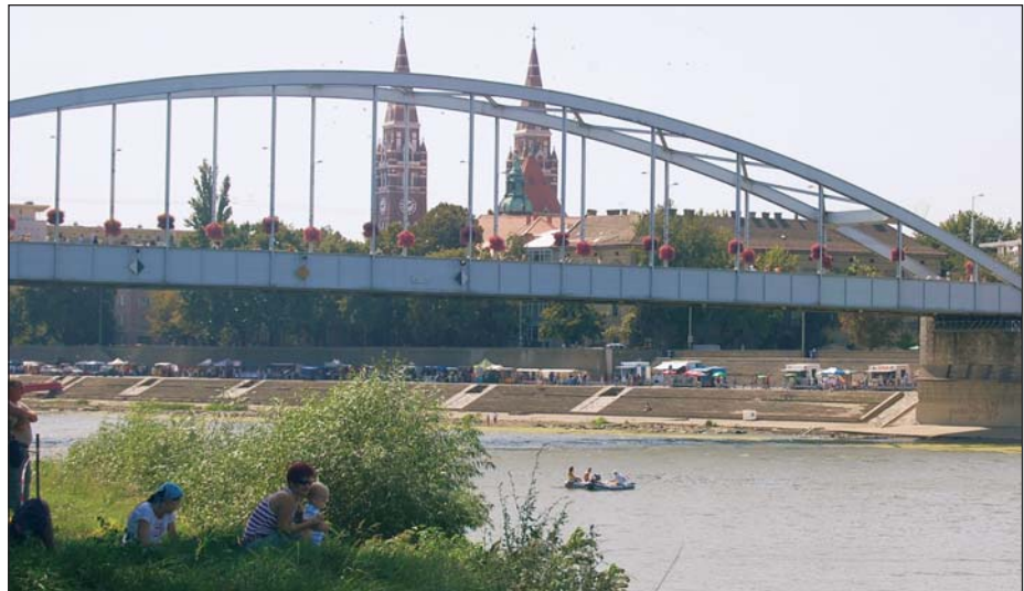
A Tisza mindkét partját elfoglalták a főzők

Hegyi Gyula elmondta, hogy a magyar vízügyi szakemberek kiválóak, ezért a harmadik világ vizes projektjeinek hasznosításában is segítséget adhatnak uniós projektek keretében. A magyar képviselő szerint az édesvíz a huszonegyedik század talán legfontosabb kincse.