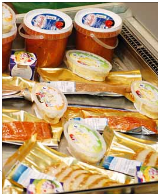
Kisbajcson évről-évre bővül a termékpaletta

– Azt, hogy egyre több olyan kollégám van, akik kiváló szakemberek, értik a dolgukat, és rájuk bízhatom a cég működtetésének egy jó részét. Így több időm marad a „hogyan tovább” kérdéssel foglalkozni. A cégnél az utóbbi években több mint félmilliárd forint értékű beruházásokat hajtottunk végre. Építettünk egy intenzív telepet, egy feldolgozó üzemet, s az intenzív telepünk már olyan állapotban van, hogy szinte magától működik. A biztonsági rendszer olyan, hogy minden pillanatban tudjuk, hogy a hal milyen állapotban van, mire van szüksége stb. A halnak jól kell éreznie magát ahhoz, hogy finom, kiváló termék készüljön belőle. A feldolgozó is a mai kor követelményeinek tesz eleget, a kollégáim jobb körülmények között végezhetik a munkájukat, és olyan körülmények között dolgozzuk fel a halat, ami biztosítja a kiváló minőséget. Az élelmiszerbiztonsági előírások betartása nálunk szent dolog, így megbízható, finom halételt teszünk a fogyasztó asztalára.