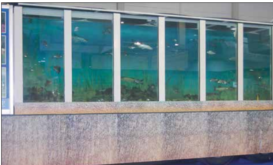
Látványos volt az akvárium halbemutató